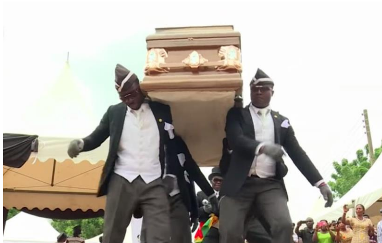
Imagem 1: Rito funerário em Gana

figurinhas e da mixagem com demais vídeos e imagens. Assim os produtores de mídia convencional e alternativo atuaram em diferentes tipos de mídia, interagindo de formas diversas.