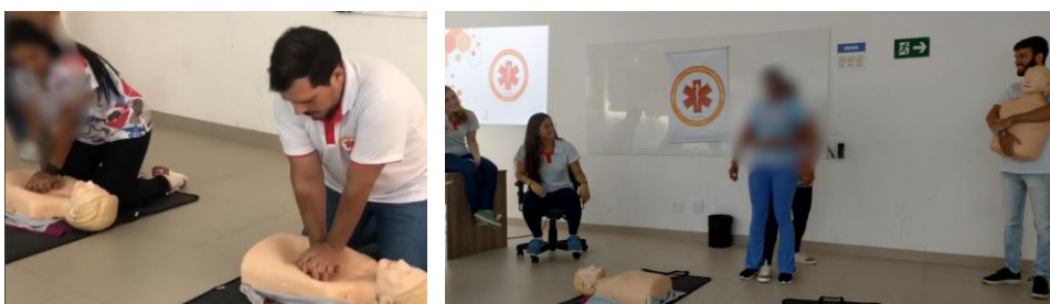
Figura 1 – Execução de Atividades

Os dados coletados, demonstraram que os participantes das atividades, experimentaram, a partir do conteúdo ministrado, um sentimento de maior preparação para lidar com situações de emergências, como as abordadas ao longo dos encontros. Durante as atividades, valeu-se de um ambiente que proporcionou a interação e o desenvolvimento das habilidades dos profissionais de saúde. O intuito foi estimular a participação e a integração, propiciando uma aura de aprendizado efetivo dos conteúdos teóricos e práticos.